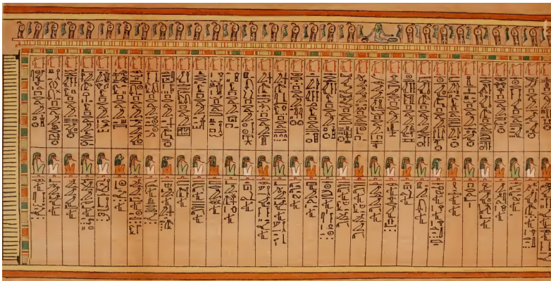
Figura 1: As Confissões Negativas.

FAULKNER, Raymond. The Egyptian Book of the Dead. The Book of Going forth by Day . Trad. e comentários R. Faulkner. San Francisco: Chronicle Books, 1998, plate 31.