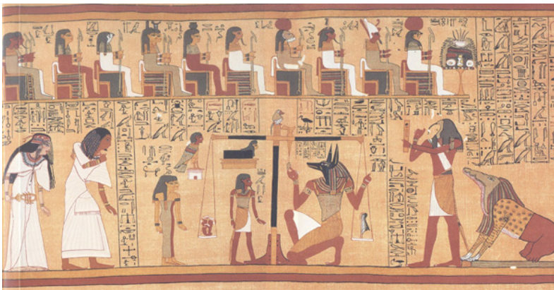
FAULKNER, Raymond. The Egyptian Book of the Dead. The Book of Going forth by Day. Trad. e comentários R. Faulkner. San Francisco: Chronicle Books, 1998, plate 3.